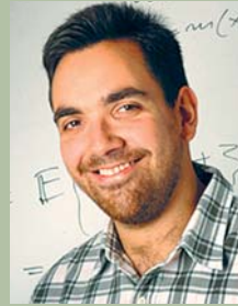
Γεώργιος-Μάριος Αγγελέτος Καθηγητής Οικονομικών, Τεχνολογικό Ινστιτούτο Μασαχουσέτης (MIT)

Τις σπουδές τους αυτές μπορούν να τις συνεχίσουν είτε στο Πανεπιστήμιό μας, είτε σε Πανεπιστήμια του εξωτερικού.