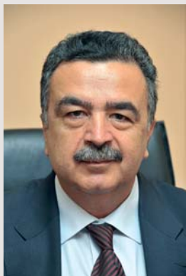
Καθηγητής Εμμανουήλ Γιακουμάκης Πρύτανης