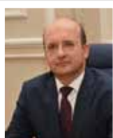
Αντιπρύτανης Διεθνούς Συνεργασίας & Ανάπτυξης Καθηγητής Βασίλης Παπαδάκης

Η Σύγκλητος αποτελεί το ανώτερο όργανο λήψης αποφάσεων του Πανεπιστημίου. Αποτελείται από τον Πρύτανη, τους Αντιπρυτάνεις, τους Κοσμήτορες των Σχολών, τους Προέδρους των Τμημάτων, τους εκπροσώπους των φοιτητών και τέλος, εκπροσώπους του διδακτικού και διοικητικού προσωπικού.