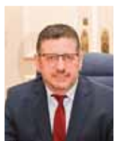
Πρύτανης Καθηγητής Δημήτρης Μπουραντώνης

Οι Πρυτανικές Αρχές του Πανεπιστημίου αποτελούνται από τον Πρύτανη και τους Αντιπρυτάνεις.