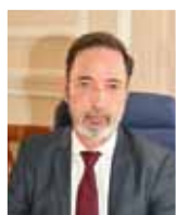
Αντιπρύτανης Έρευνας και Διά Βίου Μάθησης Αναπληρωτής Καθηγητής Γιώργος Λεκάκος