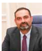
Αντιπρύτανης Οικονομικού Προγραμματισμού & Υποδομών Καθηγητής Κωνσταντίνος Δράκος